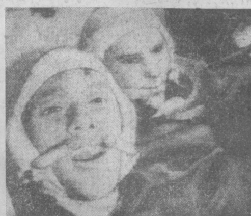
Космонавты ведут репортаж с орбиты. Снимок с экрана телевизора.