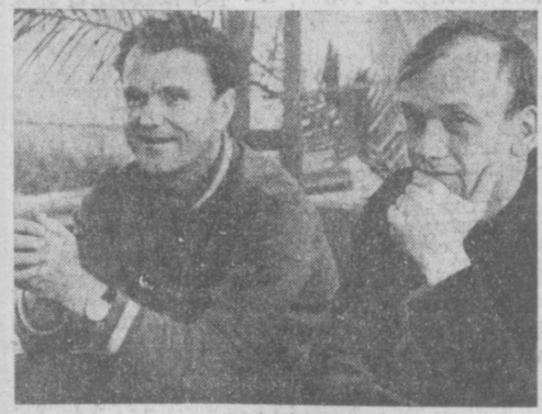
Владимир Шаталов и Алексей Елисеев на пресс-конференции перед полетом.

Центральный Комитет Коммунистической партии Советского Союза