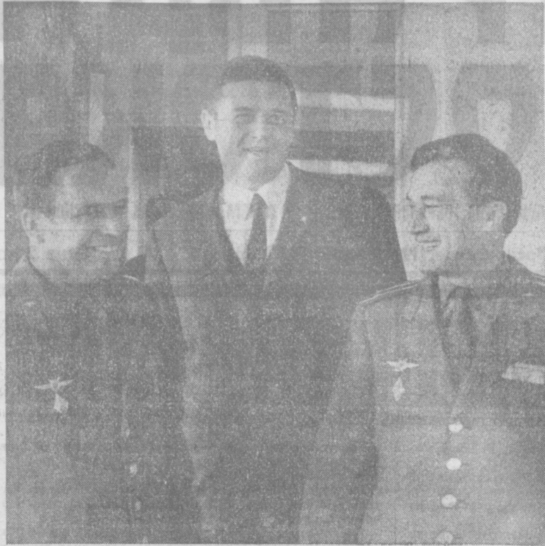
Экипаж «Союза-7» перед полетом в космос.

привыкли быстрее, чем к земному приращению. — Расскажите о вашем космическом быте. Филиппенко: — Мы быстро свмыслились с новыми условиями. Пробовали спать на диване, на полу, привязавшись, как у нас говорят, «на двух нитках». Удобнее всего спать при невесомости, привязавшись к чему-то земному. Горбатко: — Как ни странно, мы оказались сладкоежками. Даже Владислав, который любит мясо. Мы так избаловались, что перед спуском позавтракали только деликатесами. Короче говоря, съели все вкусное, а остальное оставили в орбитальном отсеке. — Беседовали ли вы перед спуском с Владимиром Шаталовым? Филиппенко: — Да, он пожелал нам мягкой посадки, и мы пожелали ему того же. В заключение журналисты остались верны себе и задали «провокационный» вопрос: — Как начали бы вы интервью при встрече с космонавтами? — Мы бы спросили их, как вы себя чувствуете, — засмеялся Владислав Волков. В. СТЕПАНОВ. 17 октября, Караганда.