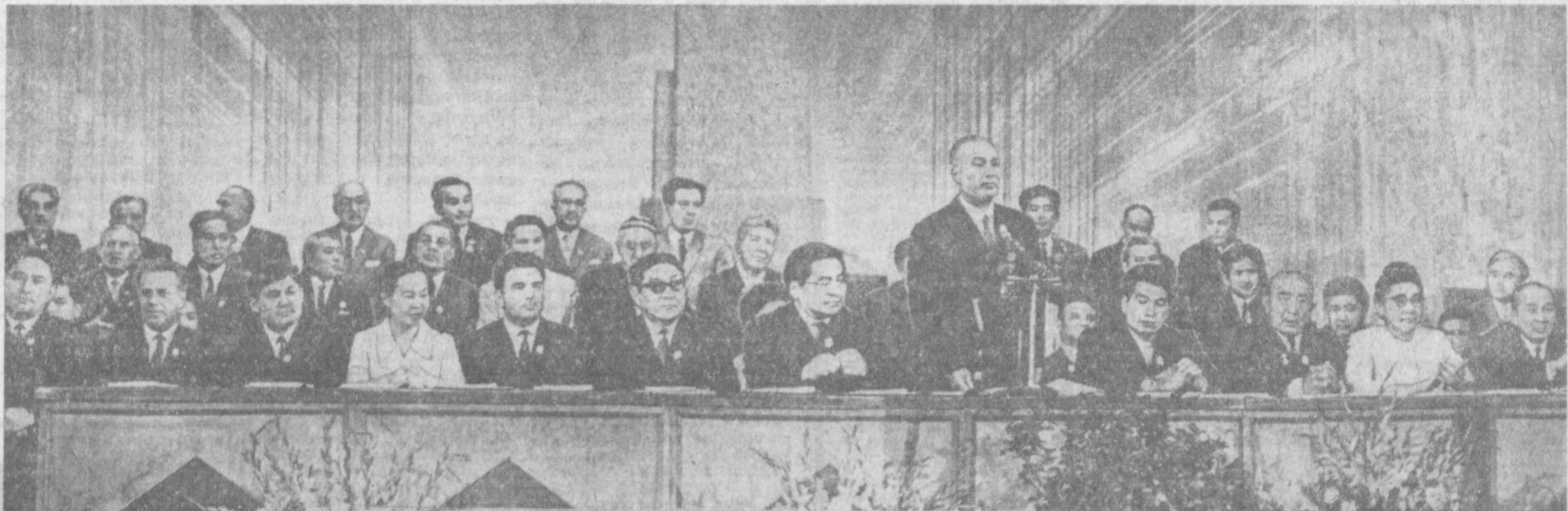
ТАШКЕНТ, 5 сентября. Государственный академический Большой театр оперы и балета Узбекской ССР имени Алишера Навои. На снимке: президиум торжественного собрания, посвященного открытию Декады литературы и искусства Киргизской ССР в Узбекистане.