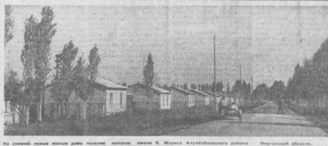
На снимке: новые жилые дома поселка колхоза имени К. Маркса Ахунбабаевского района Ферганской области.