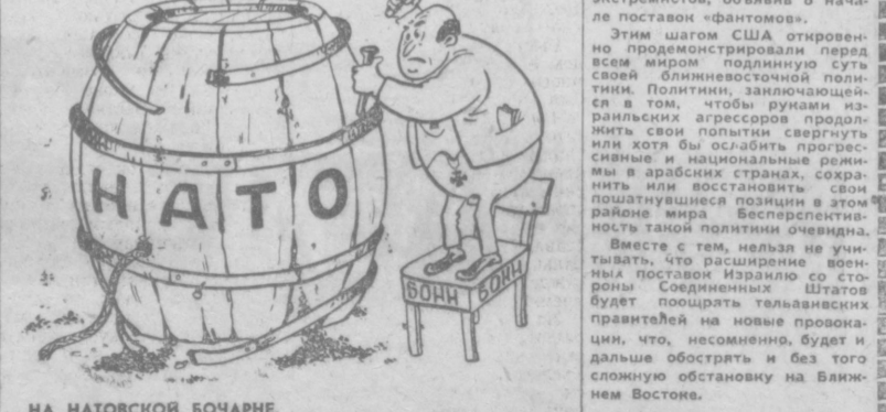
НА НАТОВСКОЙ БОЧАРНЕ. Рис. Ю. БРОДИЦКОГО.

Валдигерманские ревизионисты проявляют повышенную активность в связи с разваливающейся военной организацией НАТО.