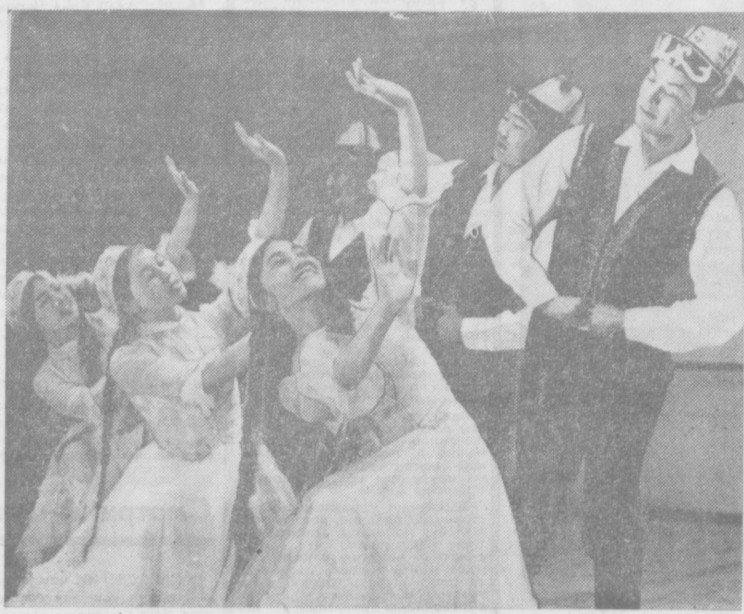
1969-й — год рождения нового творческого коллектива — Государственного ансамбля киргизского танца. Первые просмотры, репетиции, а потом концерты, концерты... Зрители были пленены ликом и искрометными танцами «Табунчики» и «Наездники», трогательным «Первым поцелуем», одухотворенными и лиричными «Журавлями», другими новинками национальной хореографии, впервые так щедро представленными сценой. В репертуаре ансамбля представлены и танцы народов СССР, зарубежных стран. Новый творческий коллектив растет, набирается сил. Объектив фотоаппарата подсмотрел и запечатлел таинство рождения национального танца Киргизии. Пусть знакомятся с ним сегодня и читатели.