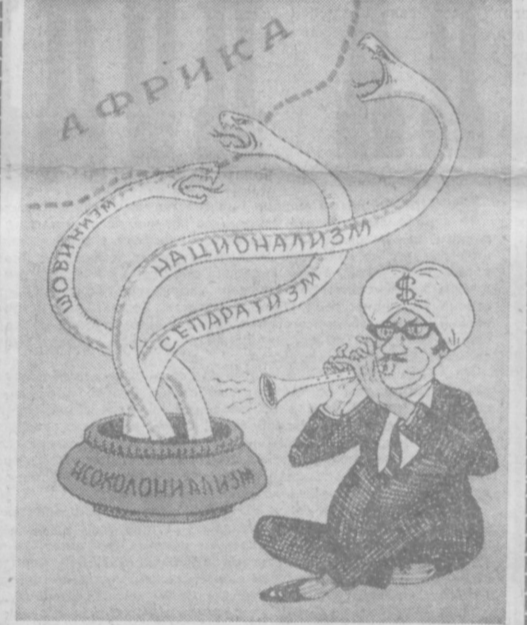
«Фанфи» из Вашингтона. Рис. Ю. БРОДИКОВО.

В целях захвата ключевых позиций в политике и экономике молодых арабских стран, империалисты Запада всячески поддерживают реакционные силы внутри этих стран.