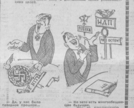
Заправлены ФРГ делают ставку на неонацистов, как на вспомогательную силу в достижении своих реакционных целей.

Выстрелы в Касселе, яро напоминание о расправах, которые устраивали в свое время нацистские штурмовики, являются следствием ожесточенной пропагандистской кампании ФРГ против демократических сил.