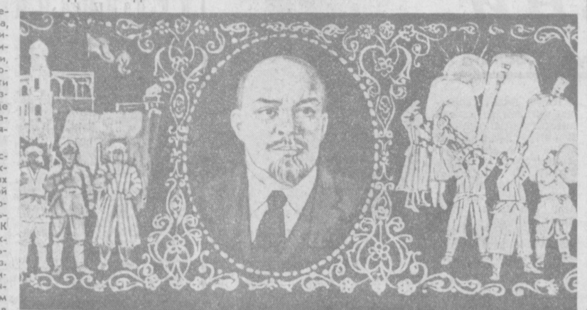
Панно «Ленин и Восток».