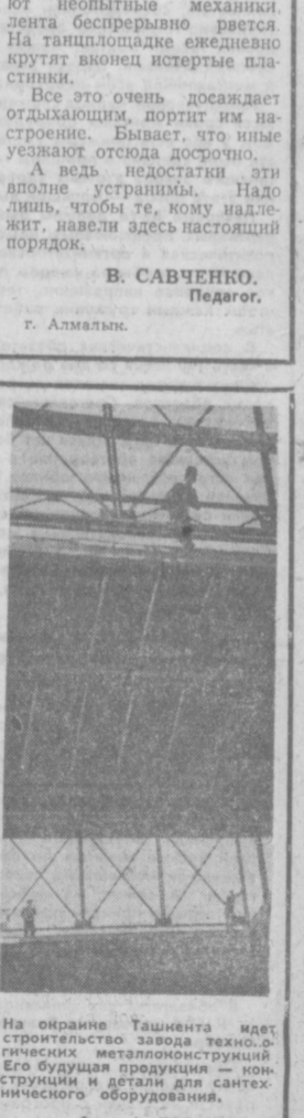
на окраине Ташкента идет строительство завода технического металла. Конструкция и детали для сантехнического оборудования.