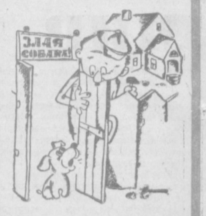
— Правильно на собрании теббя очновителем называли!