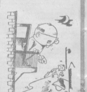
— Если будешь стрелять в лампочки, не забудь эту — всю ночь спать не дадут.