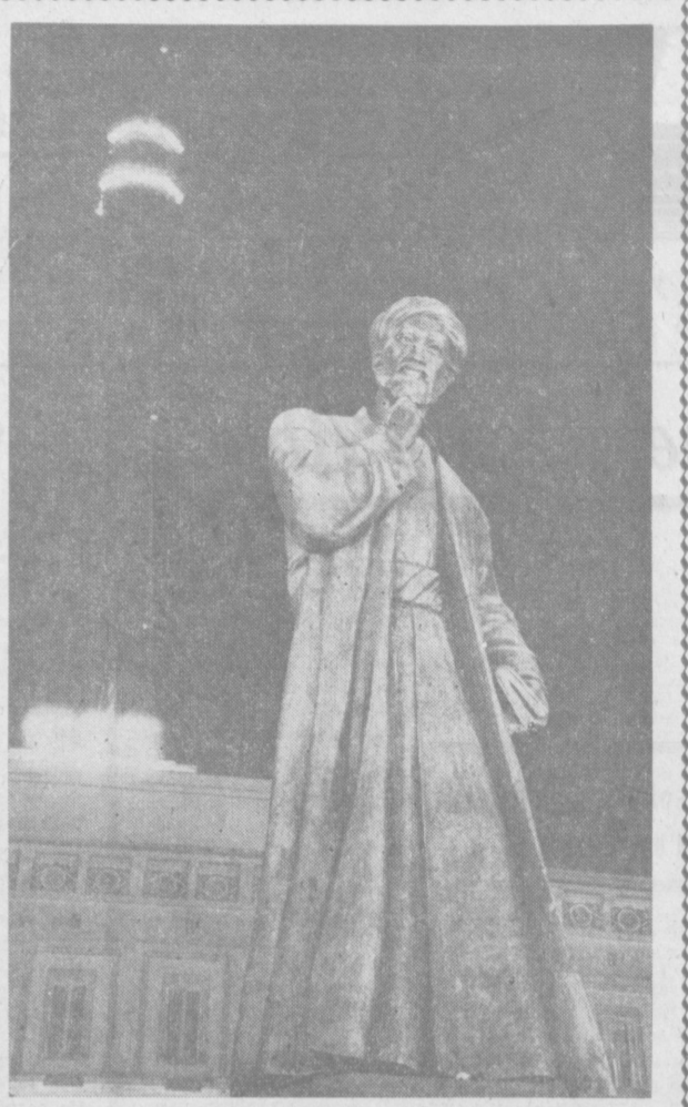
НА ФОТОКОНКУРС «ЛЮБОВЬ МОЯ, УЗБЕКИСТАН». В. ШУРИК (Ташкент). «ТЫ С НАМИ, АЛИШЕР!».

Ю. ЮДИН. Корр. Узбекского телеграфного агентства.