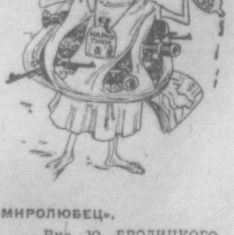
Рис. Ю. БРОДИНКОГО.

Очередные скандалы в ряде стран Латинской Америки еще раз подтвердили подрывную и шпионскую деятельность американского «Корпуса мира» — детища ЦРУ.