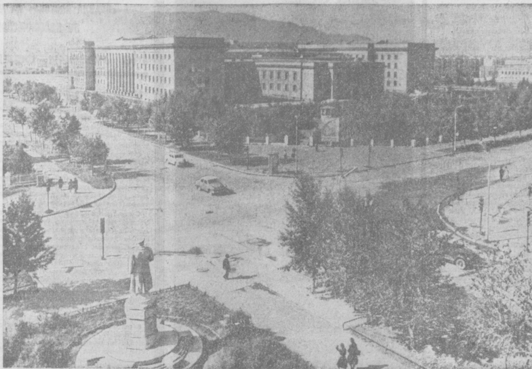
Столица Монгольской Народной Республики — город Улан-Батор. Дом правительства.