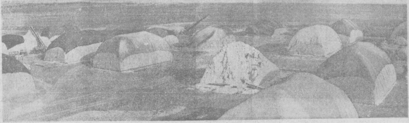
ВОТ ОН, ХЛОПОК КАШКАДАРЬИ! Общий вид Каршинского заготовительного пункта.

Выполнив план заготовки хлопка, сдав государству 215 тысяч тонн сырья, область не снижает темпов страды. Наше юбилейное обязательство — 255 тысяч тонн хлопка, но и оно будет преодолено. Есть возможность собрать с каждого гектара 32 центнера хлопка. Областная партийная организация нацелила тружеников на то, чтобы сдать на общегосударственный хирман 300 тысяч тонн «белого золота». Это будет достойный подарок к ленинскому юбилею.