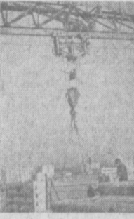
СТАРАЯ Кашгария становится самым «высоким» районом Ташкента. Здесь уже возведено много девятиэтажных жилых домов. На снимке — монтаж высотного здания.