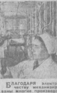
БЛАГОДАРЯ электричеству механизированы многие производственные процессы в совхозе «Красный водопад». Электричество приводит в действие и дольные установки.