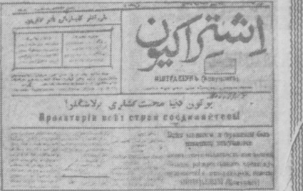
Одна из первых газет Советского Туркестана.

Узбекистан стал крупнейшим научным центром Советского Востока. Он имеет 132 научно-исследовательских учреждения, около 20 тысяч научных работников, в том числе 350 докторов наук и 4.350 кандидатов наук. Более половины многонациональной семьи научных работников составляют узбеки. Респуб-