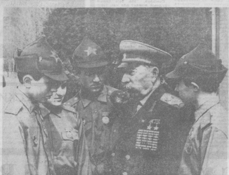
На снимке: С. М. Буденный среди юных красных следопытов (1967 год).