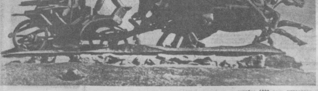
«Легендарная тачанка». Этот монумент воздвигнут в степи под Каховой на месте, где в октябре 1920 года находился командный пункт героической Первой Конной армии...