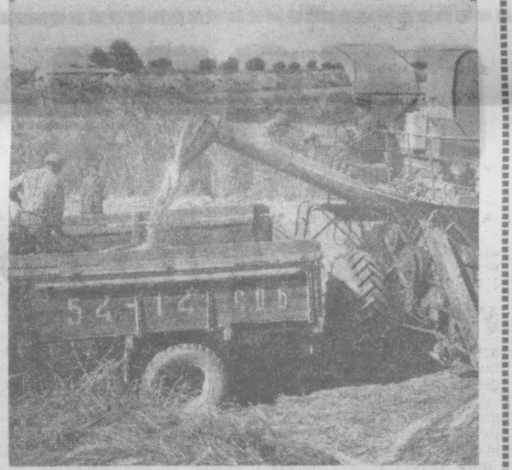
Богатый урожай риса вырастили земледельцы колхоза «Москва» Джаркурганского района. С каждого из 170 гектаров собрано по 40 центнеров «жемчужного зерна». Рисоводы хозяйства обильно дополнительно продали государству еще 640 тонн риса. На фронте: комбайновая уборка риса в колхозе.