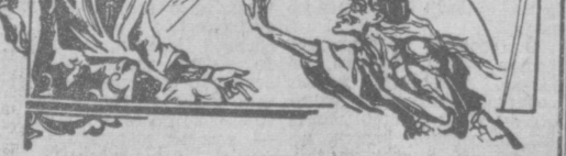
Иллюстрация к «Сказанию о Шарьяре».