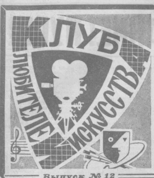
Выпуск № 12