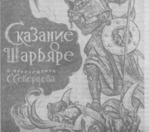
Иллюстрация к «Сказанию о Шарьяре».