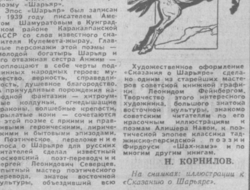
Иллюстрация к «Сказанию о Шарьяре».