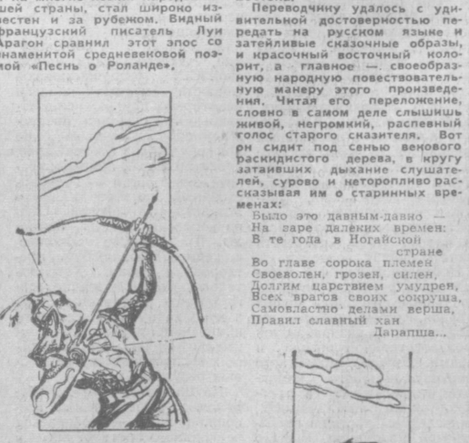
Иллюстрация к «Сказанию о Шарьяре».