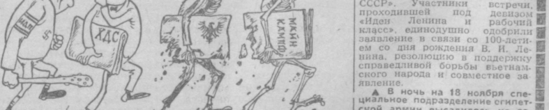
— Ступай в след, и никто не заметит, что политика по сути одна и та же! Рис. Ю. ВРОДИЦКОГО.

Вечером посланцы Южного Вьетнама смотрели в Государственном театре оперы и балета имени А. Навои спектакль «Сухайль и Мехри». (УзТАГ).