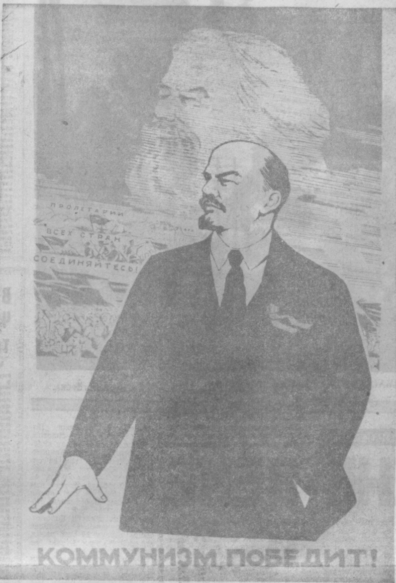
Плакат художника А. НАЗЫРОВА. (Агитплакат «Боевой карандаш».)