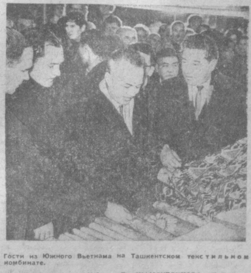
Гости из Южного Вьетнама на Ташкентском текстильном комбинате.

фронта освобождения, посол Республики Южный Вьетнам в Советском Союзе Данг Куанг Миян. В поездке по стране делегацию сопровождает заведующий отделом МИД СССР М. С. Капича. Находящаяся в Узбекистане делегация Национального фронта освобождения Южного Вьетнама и Временного революционного правительства Республики Южный Вьетнам 20 ноября надела визит нагрудки в члены Политбюро ЦК КПСС, первого секретаря ЦК Компартии Узбекистана Ш. Р. Рашидова. В беседе, проходившей в атмосфере братской сердечности, Ш. Р. Рашидов от имени всех трудящихся Узбекистана передал горячий привет героическому вьетнамскому народу, пожелал ему дальнейших успехов в справедливой борьбе против агрессии американского империализма. Трудящиеся Узбекистана, верные своему интернациональному долгу, будут и впредь крепить солидарность с вьетнамским народом, оказывать ему всемерную поддержку и помощь. Глава делегации — председатель Президиума ЦК Национального фронта освобождения Южного Вьетнама и председатель Консультативного совета Временного революционного правительства Республики Южный Вьетнам доктор Нгуен Ху Тхо рассказал об успехах патриотов Южного Вьет-