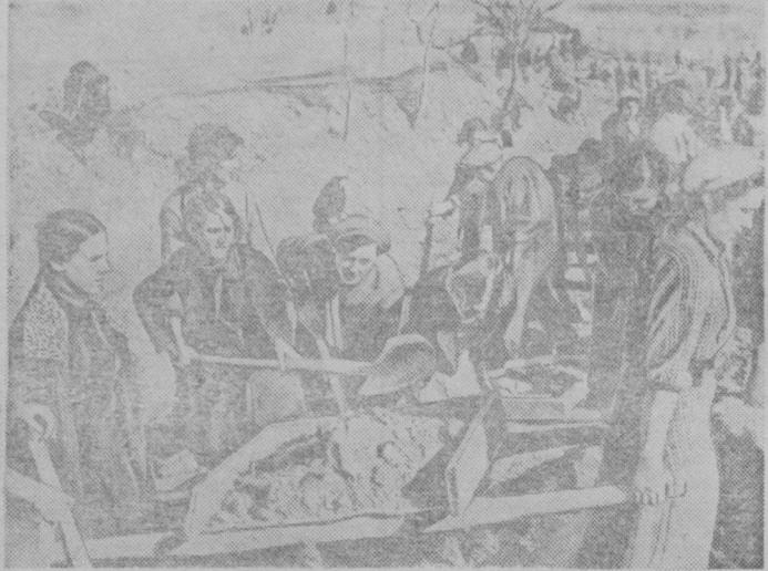
На строительстве Ташкентской детской железной дороги. На снимке: ученики средней школы № 121 имени Карова строят железнодорожку на дачу.

ЛОНДОН, 27 февраля (ТАСС). Дипломатический обозреватель газеты «Дейли телеграф энд Морнинг пост» пишет, что английские политические круги в последние дни уделяют большое внимание обсуждению вопроса об англо-итальянских торговых отношениях. Англия желает закупать у Италии машины и другую продукцию тяжелой индустрии в обмен на уголь. Италия, однако, со своей стороны желает экспортировать в Англию овощи и фрукты, на что не соглашается Англия. Трудовость, возникшие в связи с экспортом и получением итальянской промышленной продукции, нужной Англии, привели к затруднениям в ведении торговых переговоров между этими двумя странами.