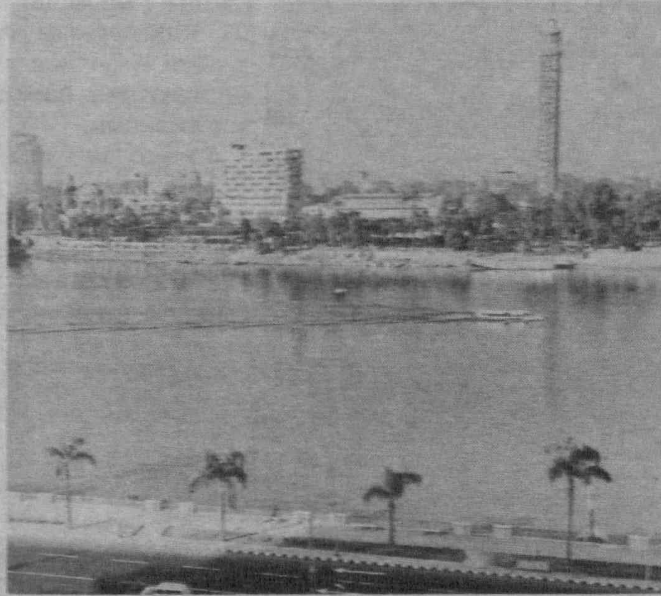
На снимке: набережная реки Нил в Каире.

(По материалам средств массовой информации).