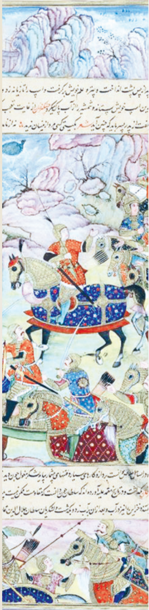
Юлдуз ЎРМОНОВА тайёрлади.