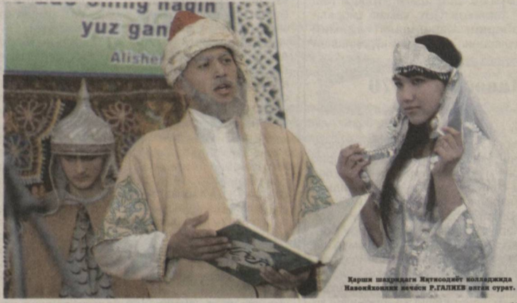
Тарихи рашидийда Навоийнинг қисқабанлиги ҳақидаги сурат.

“Бобурнома” ва “Тарихи Рашидий”да Навоий сиймоси