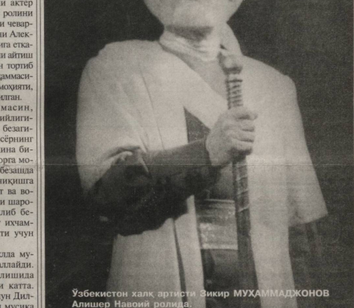
Ўзбекистон халқ артисти Зикир МУҲАММАДЖОНОВ Алишер Навоий ролида.

Кўрсатув савиясининг ошишида овоз режиссёри ва мусиқа муҳаррирининг ҳам ўрни катта. Зеро, қандай мусиқадан қай вақтда фойдалана билиш ҳам ниҳоятда муҳимдир. Кези келганда шуни ҳам айтиш лозимки, дидактик кўрсатувларнинг аксариятида майиший