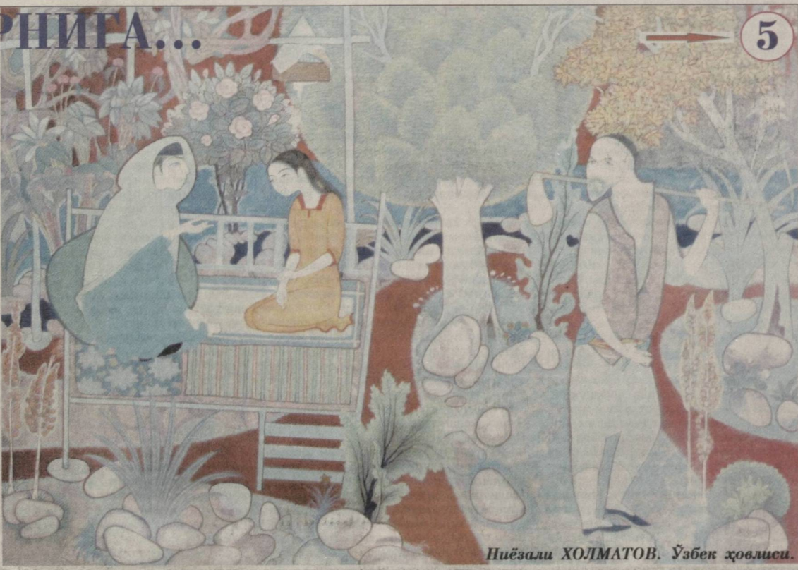
Ниёзали ХОЛМАТОВ. Ўзбек ҳовисиси.