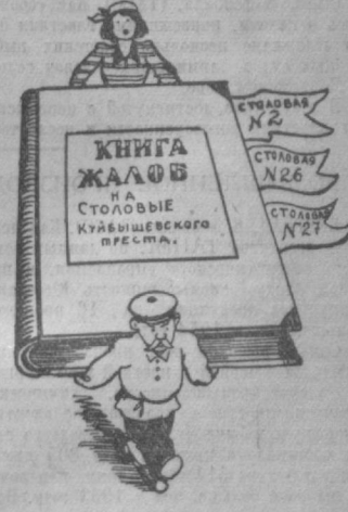
Поскорее бы освободиться от этой тяжелой ноши... Рис. П. Касьянова.

Подобные недостатки можно наблюдать в столовой № 26, обслуживающей студентов САГУ, в столовой № 27 и других. Не случайно в этих столовых много жалоб на плохое качество обедов.