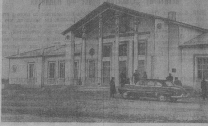
На снимке: здание клуба колхоза имени Карла Маркса, Ангорского района, Сурхандарьинской области.

Сессия рассмотрела также организационные вопросы.