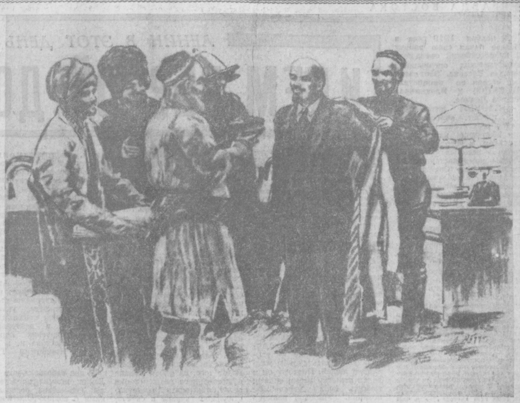
Трудящиеся Туркестана на приеме у В. И. Ленина. Репродукция с картины народного художника Узбекистана Лутфулла АБДУЛЛАЕВА.