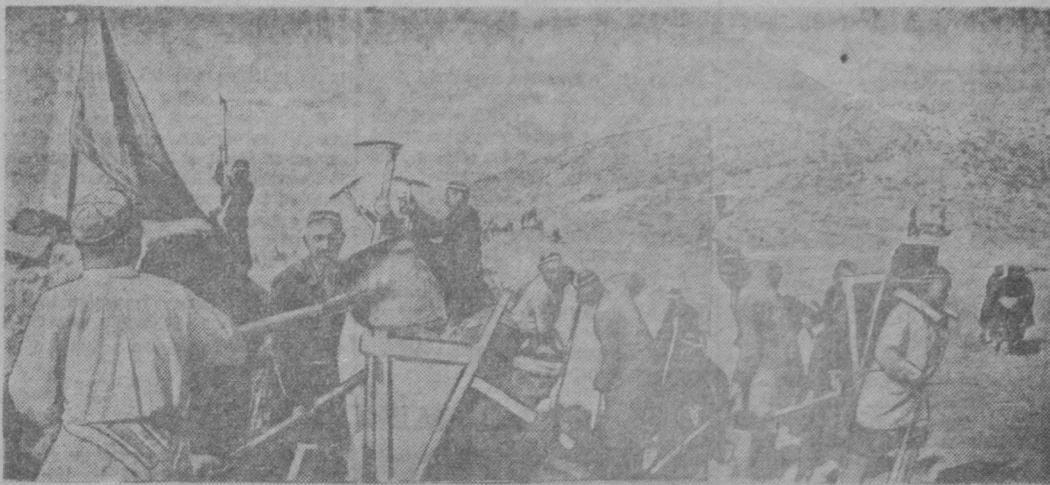
Дусматовскими методами работали члены колхоза им. Орджоникидзе, Кушинского района, на строительстве Южного Ферганского канала. План земляных работ колхоз выполнил на 250 процентов. Фото В. Лойна (Фотохроника УэТАГ).

Заместитель начальника строительства ЮФК по партийно-массовой работе.