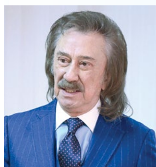
Фаррух ЗОКИРОВ, Ўзбекистон халқ артисти

– Собиқ Свердлов номидаги концерт зали биноси негизда қайта қурилган «Касаба уюшмалари саройи»ни кўриб, очиги, ҳайратим ортди. Айни вақтда хотираларнинг уйғонишига туртки берди. Сабаби ушбу сарой ўз вақтида нафақат пойтахтнинг, балки мамлакатимизнинг муҳим маданий маскани бўлган. Бу ерда элимизнинг дунё тан олган фарзандлари Комилжон Отаниёзов, Карим Зокиров, Фахриддин Умаров, Тамираҳоним, Ҳалима Носирова, Ботир Зокиров каби санъат дарғалари концерт берган. Хусусан, «Ялла» ансамбли ҳам ўз ижодини шу ердан бошлаган. Афсуски, шундай табаррук маскан бир неча йиллардан буён қаровсиз ҳола тушиб қолган эди. У ташкилотдан бу ташкилотга ўтавериб нуфузига, тарихий қийматига путур етди.