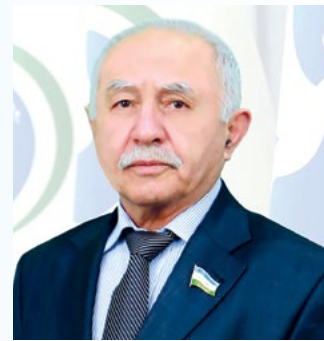
Хуршид ДУСТМУХАММАД, Ўзбекистон Республикаси Олий Мажлиси Қонунчилик палатаси депутати, адабиётшунос олим