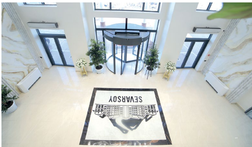
Ғулумжон МИРАҲМЕДОВ «ISHONCH»

Тадбирга санъат усталари дилрабо куй-қўшиқлари билан янада фойз киритдилар.