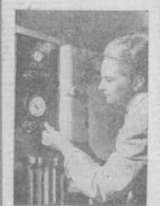
В научно-исследовательской лаборатории ферментов...