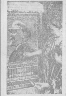
На Хивинской ковроткацкой фабрике имени Крупской...