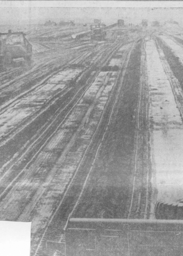
ОБОВЬ МОЯ, УЗБЕКИСТАН. В. СВАРИЧЕВСКИЙ (Ташкент). ШТУРМ ГОЛОДНОЙ СТЕПИ.

Фергана — Ташкент. Перевод с узбекского А. НАУМОВА.