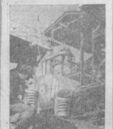
На Навоийской ГРЭС завершен строительство...