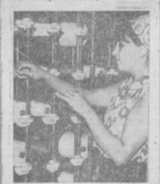
Шесть лет трудится на Маргиланском шелководном комбинате...