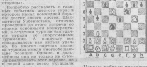
Черные избрали продолжения, связанные с жертвой ладьи...