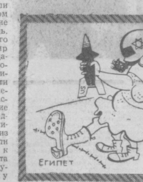
Перешла все границы... Рис. Д. СИННИКОВО.