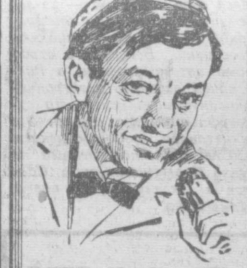
Е. ЕФИМОВ. Корр. Узбекского телеграфического агентства.

ПРЕДСТАВИТЬ его не надо. Юсупович так же популярно, как и исполняемые им песни.