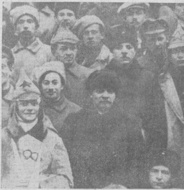
В. И. Ленин и К. Е. Ворошилов в группе делегатов X съезда РКП(б) — участников подавления Кронштадтского мятежа. Москва, март 1921 года.

Долг правительства, политических и общественных организаций всех стран, действительно проявляющих заботу о сохранении мира, сплачивать фронт борьбы в защиту национальных чаяний и неотъемлемых прав вьетнамского народа на независимость и свободное развитие, еще более усилить поддержку и солидарность с борющимся Вьетнамом. Вьетнамский народ сражается за справедливое дело, и он победит!