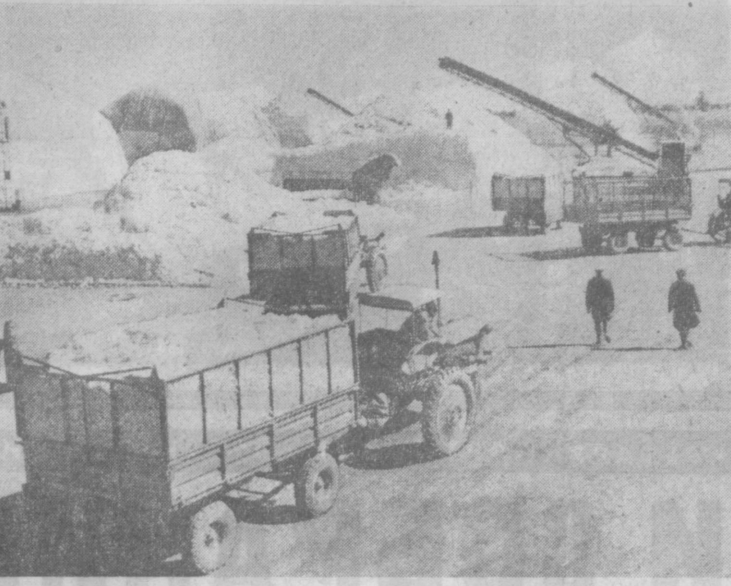
На нашем снимке — заготовительный пункт Зандани Ромитанского района. В разгар страды сюда поступало по 250—300 тонн хлопка ежедневно. Там же горы «белого золота» высит в своих угодьях орденосной Бухарской области, труженники которой выполнили план продажи хлопка государству и сейчас упорно борются за выполнение социалистического обязательства.