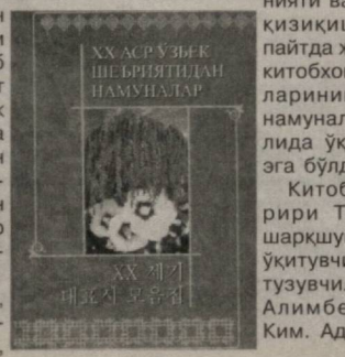
XX аср ўзбек шеърлятидан намуналар китоби.

Ҳамид Олим- жон, Мирте- мир, Абдулла Орипов, Эр- кин Воҳидов ва бошқа ўзбек шоирларининг, жами ўттиз беш нафар ижодкорнинг шеърлари- дан намуналар аслият ва корейс ти- лидаги таржимада ёнма-ён берил- ган. Бутун дунёда Ўзбекистон мада- нияти ва санъатида катта кизиқиш уйғонган бир пайтда жанубий корейлик китобхонлар ўзбек шоир- ларининг асарларидан намуналарни ўз она ти- лида ўқиш имкониятига эга бўлдилар. Китоб масъул муҳар- рири Тошкент давлат шарқшунослик институти ва институтида фаолият кўрсатаётган жанубий корейлик тар- жимонлар томонидан Ўзбекистон Ёзувчилар уюшмаси билан ҳамкор- ликда тайёрланди. Мажмуада Чўлпон, Гафур Гулом, Ойбек, Уй- гун, Мақсуд Шайхзода,