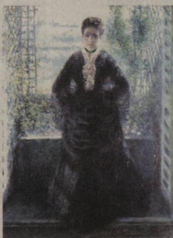
Огост РЕНУАР, "Мадам Шоке".