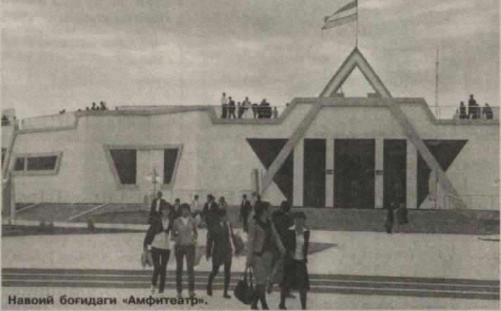
Навоий боғидаги «Амфитеатр».

лигига бош-қош. Шаҳар оройиши, таро- вати, муаттарлиги учун масъул. У дарахт нодаларидаги ҳар бир япроқ- ни, гулу гулзорлардаги ошuftаликни асраб-авайлаш учун 75 нафар гулчи аёл билан ҳамфикр иш олиб боради.