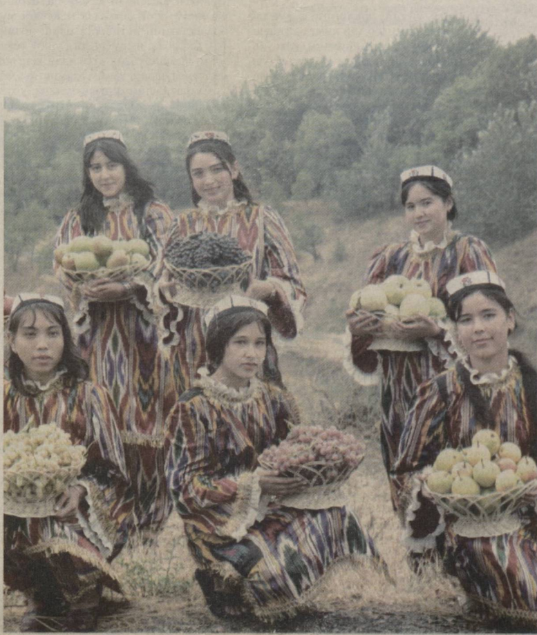
Олтин куз саховата.

Ўзбекистоннинг истиқлол арафасидаги чуқур инқироз ҳолати ва бу инқироз-