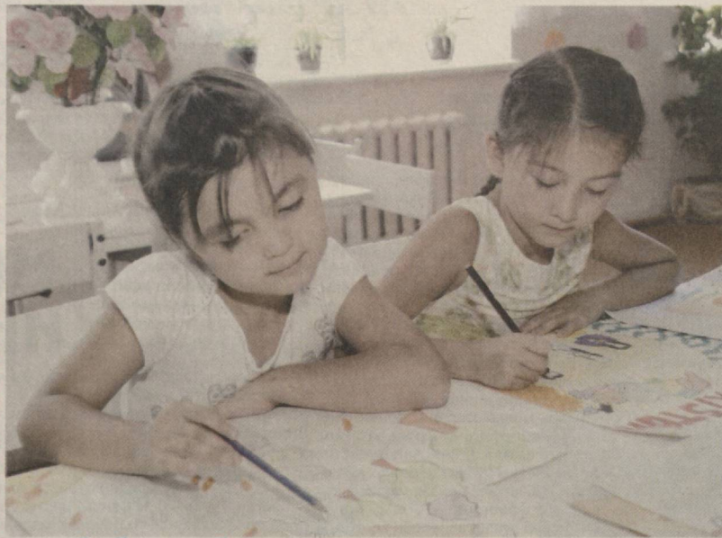
— Албатта «5» оламан...

Танловга оид ҳужжатлар 2011 йил 31 декабргача қабул қилинади.