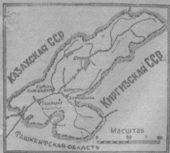
Центр Бостандыкского района — Газалкент и его окрестности.