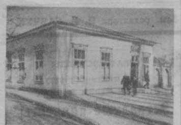
БАНЯ. Ее пропускная способность — более 500 человек в день.

На фотографиях, помещенных выше, показаны лишь некоторые культурно-бытовые учреждения, построенные в колхозе за последние годы одновременно с возведением многих крупных производственно-хозяйственных объектов.