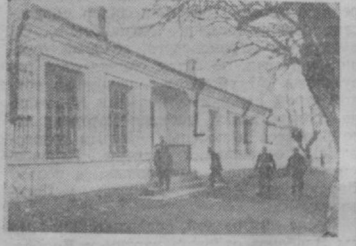
ГОСТИНИЦА. В ней останавливаются приезжающие в центральную усадьбу члены артели из отдаленных участков колхоза.