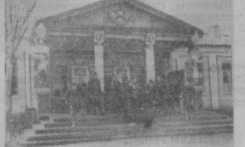
ШКОЛА. Одна из пяти в колхозе. В Заркенте работают 53 учителя.