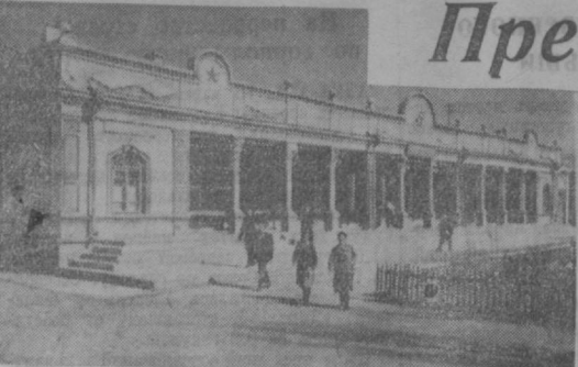
КЛУБ на 800 мест. При Доме культуры работают самодеятельные кружки. Организован первый колхозный духовой оркестр.