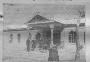
ОБЩЕЖИТИЕ. В нем живут преимущественно старшенкляссники из отдаленных кишлаков колхоза.