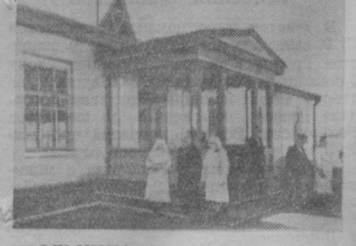
БОЛЬНИЦА. Имеет колхоз и родильный дом. Сейчас строится респираторный кабинет.