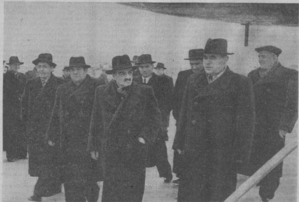
Из Ташкента в Карачи вылетел Первый Заместитель Председателя Совета Министров СССР А. И. Микоян. На снимке: А. И. Микоян на Ташкентском аэродроме.

Во время своего пребывания в Ташкенте А. И. Микоян ознакомился с городским хозяйством, посетил пионерский колхоз «Баяз Узбекистан». Всюду встречаясь тепло приветствовали А. И. Микояна. (УзТАГ).