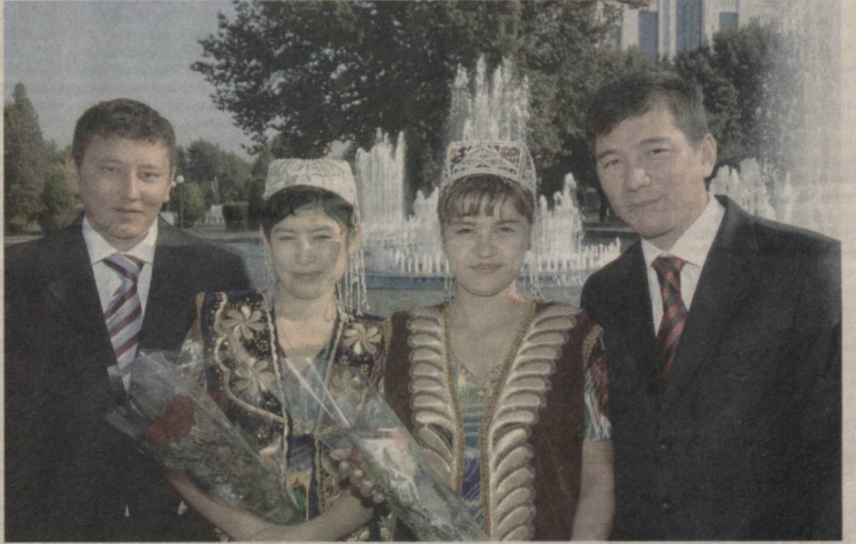
10 декабр — Ўзбекистон Республикаси Давлат мадҳияси қабул қилинган кун