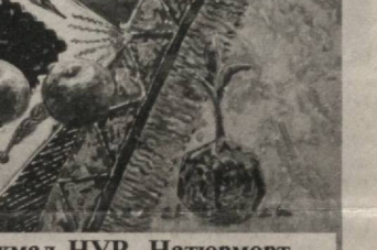
АкмаЛ НУР. НатюрморТ.

— Албатта, хорижий ва биздаги танқидчилик орасида фарқ катта. Хорижлик мутахассислар таққослаш усулидан кенг фойдаланишади. Кичик деталдан тортиб, йирик объектга таҳлил қўзи билан