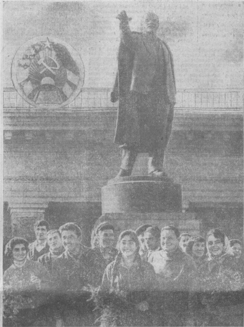
Все советские республики участвуют в строительстве Ташкента. Среди монтажников, бетонщиков, каменщиков — люди шестидесяти национальностей. На снимке: молодые строители Ленинского проспекта у памятника Ильичу.

На снимке: проспект имени В. И. Ленина в Ташкенте. (Снимок сделан с вертолета, пилотируемого летчиком Д. Дьяконовым).