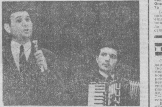
Поэт Ильгам Шакиров.

КАЖДЫЙ раз, когда в наш город приезжает артист из Казани, мы очень внимательно к нему готовимся, зная, что здесь любят народную музыку, песни и танцы. Составила репертуар, мы стараемся побольше включить в него новых музыкальных произведений. Так будет и в этот раз. Эти слова Ильгам Шакиров сказал на прощальном концерте в прошлом году. И вот новая встреча ташкентцев с народным артистом Татарской АССР. Певец сдержал свое слово и привез обновленный репертуар. В зале звучат произведения татарских композиторов. Песня сменяется песней. Особенно тепло встретили артиста песню «Гульмарьям», автором которой является сам И. Шакиров. За вечер артист исполнил более пятнадцати произведений. Успех певца разделял инструментальный ансамбль «ИДЕЛ», который прекрасно аккомпанирует И. Шакирову. На смену песни приходят чудесные танцы. Их исполняет заслуженная артистка Татарской АССР Файгуна Абуллина. Артисты Татарской государственной филармонии имени Габдуллы Тукая побывают с концертами в Самарканде, Бухаре, Термезе и других городах республики. М. МАХМУТОВ.