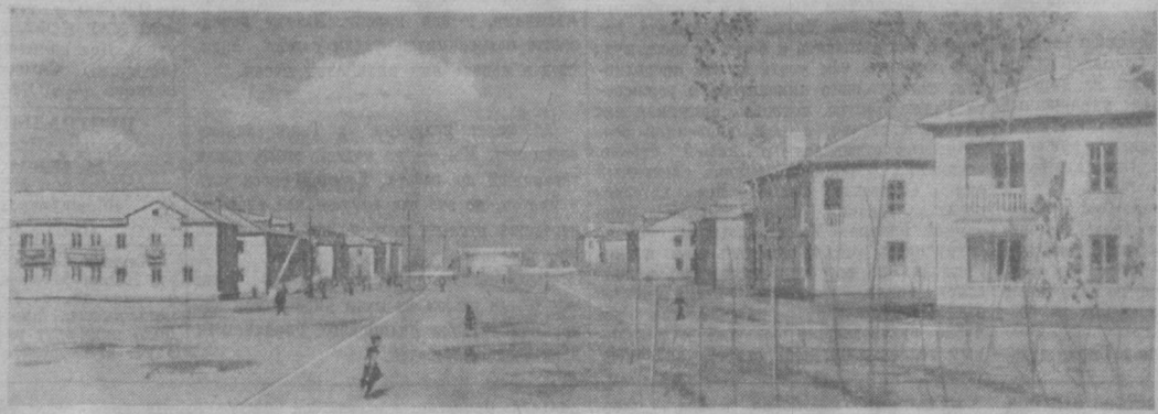
Вырос городок строителей нефтеперерабатывающего завода. На снимке: вид на одну из многих пока еще безымянных улиц.

А. АЛЬШЕВА. Заместитель управляющего трестом № 8 по быту.