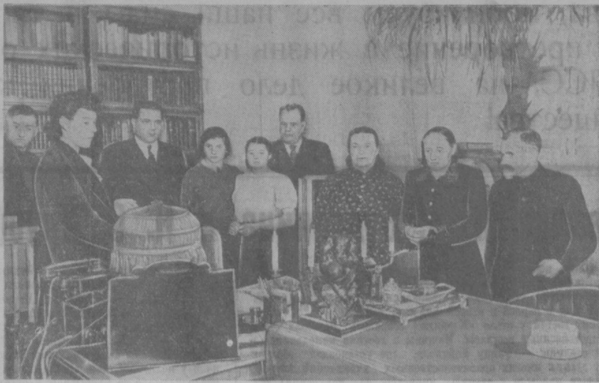
Москва. В эти дни в связи с приближающейся 86-й годовщиной со дня рождения В. И. Ленина многочисленные группы экскурсантов посещают рабочий кабинет и квартиру В. И. Ленина в Кремле. Сюда приходят рабочие, колхозники, служащие, учащиеся. На снимке: колхозники сельскохозяйственной артели «Путь Ильича» (село Кашино), Волоколамского района, Московской области, в кабинете В. И. Ленина.

Областная библиотека имени Ибн-Сины проводит читательскую конференцию на тему: «Образ Ленина в художественной литературе».