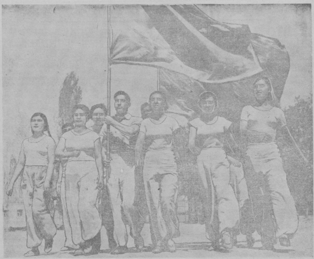
В первомайской демонстрации будет участвовать пятитысячная колонна физкультурников Ташкента. На снимке: студенты республиканского физкультурного техникума готовятся к демонстрации.

Несмотря на то, что английские военно-морские силы уже в течение нескольких дней держат Нарвик под артиллерийским огнем, они все же ни разу не сделали попытки высадить в Нарвике десант.