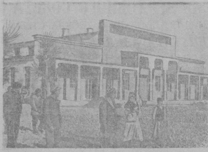
Колхоз-инвалидов «Интернационал» Пенского района, выстроил клуб на 900 мест стоимостью в 250 тысяч рублей. На снимке: наружный вид нового клуба.

Преподаватель математики готовит в школах, техникумах, вузах, гор. Ташкент, Самаркандские, 25. 1164 2185-3