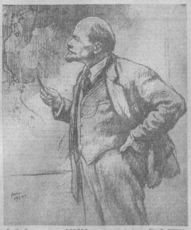
В. И. Ленин в карты ГОЭЛРО. Рис. Н. ЖУКОВА.

— РАБОЧЕ-КРЕСТЬЯНСКАЯ СОВЕТСКАЯ РЕСПУБЛИКА НАЧАЛА СИСТЕМАТИЧЕСКУЮ И ПЛАНОВЕРНУЮ ЭЛЕКТРИФИКАЦИЮ НАШЕЙ СТРАНЫ. КАК НИ, СКУДНО, КАК НИ СКОРОМНО НАШЕ НАЧАЛО, КАК НИ НЕВЕРОЯТНО ВЕЛИКИ ТРУДНОСТИ ЭТОГО ДЕЛА ДЛЯ СТРАНЫ, КОТОРУЮ РАЗОРИЛИ ПОМЕЩИКИ И КАПИТАЛИСТЫ 4-Х ЛЕТНЕЙ ИМПЕРИАЛИСТИЧЕСКОЙ И 3-Х ЛЕТНЕЙ ГРАЖДАНСКОЙ ВОЙНЫ, ДЛЯ СТРАНЫ, КОТОРУЮ ПОДКАРАУЛИВАЕТ БУРЖУАЗИЯ ВСЕГО МИРА, ЖЕЛЯЯ РАЗДАВИТЬ ЕЕ И ПРЕВРАТИТЬ В СВОЮ КОЛОНИЮ, КАК НИ МУЧИТЕЛЬНО МЕДЛЕННО ИДЕТ ВПЕРЕД ЭЛЕКТРИФИКАЦИЯ У НАС, А ВСЕ ЖЕ ОНА ИДЕТ ВПЕРЕД. — МЫ ДОЛЖНЫ ИМЕТЬ НОВУЮ ТЕХНИЧЕСКУЮ БАЗУ ДЛЯ НОВОГО ЭКОНОМИЧЕСКОГО СТРОИТЕЛЬСТВА. ЭТОЙ НОВОЙ ТЕХНИЧЕСКОЙ БАЗОЙ ЯВЛЯЕТСЯ ЭЛЕКТРИЧЕСТВО. — ЭЛЕКТРИФИКАЦИЯ НА ПОЧВЕ СОВЕТСКОГО СТРОЯ СОЗДАСТ ОКОНЧАТЕЛЬНУЮ ПОБЕДУ ОСНОВ КОММУНИЗМА В НАШЕЙ СТРАНЕ. — КОММУНИЗМ — ЭТО ЕСТЬ СОВЕТСКАЯ ВЛАСТЬ ПЛЮС ЭЛЕКТРИФИКАЦИЯ ВСЕЙ СТРАНЫ.