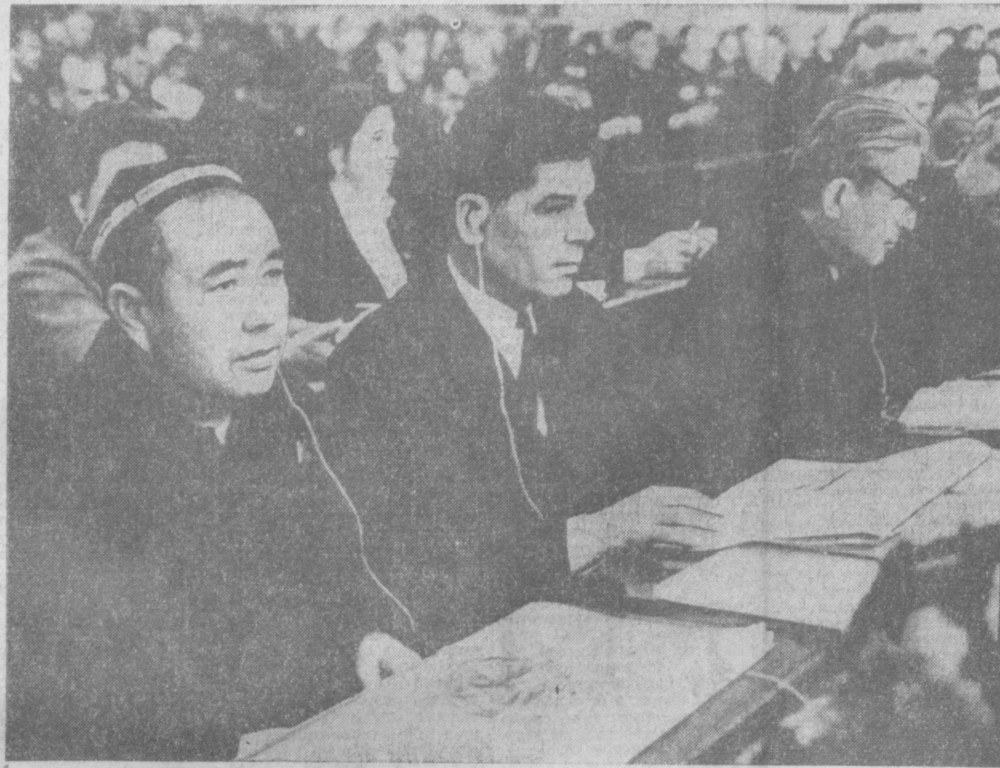
В зале заседаний Верховного Совета СССР. На переднем плане — депутаты из Узбекской ССР.

Узбекистан на ленинской трудовой вахте пятилетки