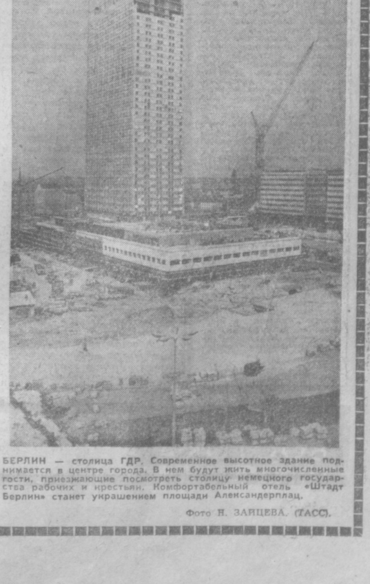
БЕРЛИН — столица ГДР. Современное высотное здание поднимается в центре города. В нем будут жить многочисленные семьи, приезжающие посмотреть столицу. Комфортабельный отель «Штадт Берлин» станет украшением площади Александерплац.

Когда-то давно загорелся в воздухе самолет. Бортрадист Сорокин струсил и без команды покинул машину. За ним — уже по приказу командира прыгнул второй пилот Егоров. Командир же погиб. Эта воздушная катастрофа обернулась человеческой катастро-