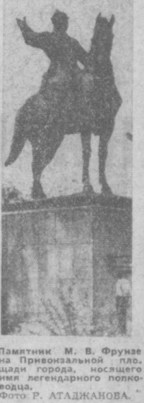
Памятник М. В. Фрунзе на Привокзальной площади города, носителя легендарного полководца.

▲ АЛМА-АТА. Открылось регулярное движение самолетов «ИЛ-16» на трассе Алматы — Усть-Каменогорск — Усть-Каменогорск — Москва. Усть-Каменогорск — десятый город Казахстана, принимающий эти быстролетные лайнеры. В настоящее время уже перевезли более четырех миллионов пассажиров.