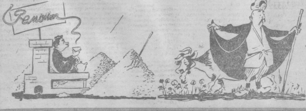
Рис. Д. Синичного и М. Воробейникова.

Хлопок — всенародное достояние, его надо беречь. В республиканском Комитете народного контроля состоялись совещание, на котором выработаны меры борьбы с потерями. Народные дозорные должны активизировать работу, закрыть все каналы потерь.