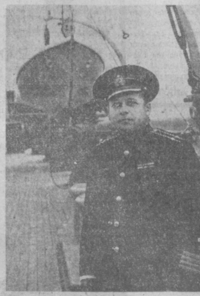
А. Н. Косыгин