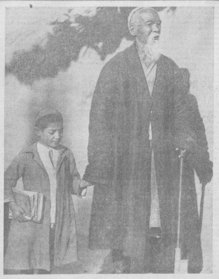
1920 год. Идут в линбез.