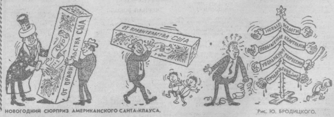
НОВОГОДИННИЙ СУПРИЗ АМЕРИКАНСКОГО САНТА-КЛАУСА.