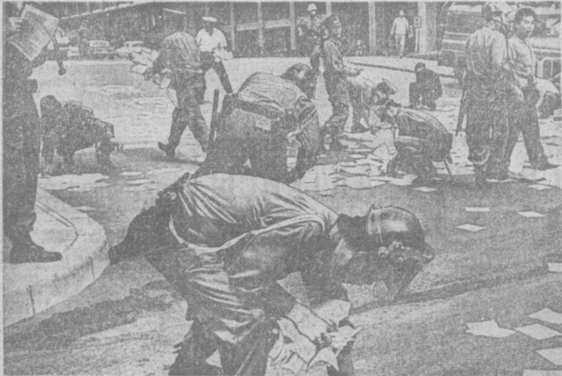
МАСТЕРА СОВЕТСКОГО ФОТО — «ПРАВДЕ ВОСТОКА» А. СТЕШАНОВ (Москва), ЯПОНИЯ. ЛИСТОВКИ, ЛИСТОВКИ...

Сообщают корреспонденты ТАСС, АПН и «Правды Востока»