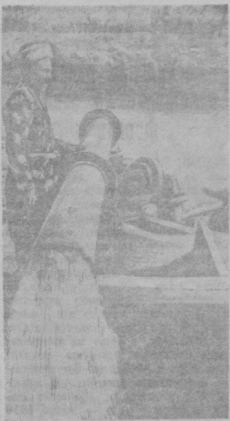
Вместо доплатных чистей в колхозе Караульского района Бухарской области установлены насосы, натекающие воду для полива хлопковых полей. На снимке: насос, установленный в колхозе им. Кагановича, в действии.

Начальник отдела общего надзора прокуратуры УзССР.