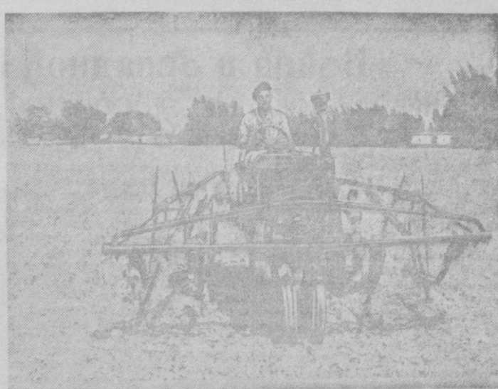
Универсалы первой Орджоникидзе-МТС тов. П. М. Набстинков обрабатывают хлопчатник в колхозе им. Чапаева.