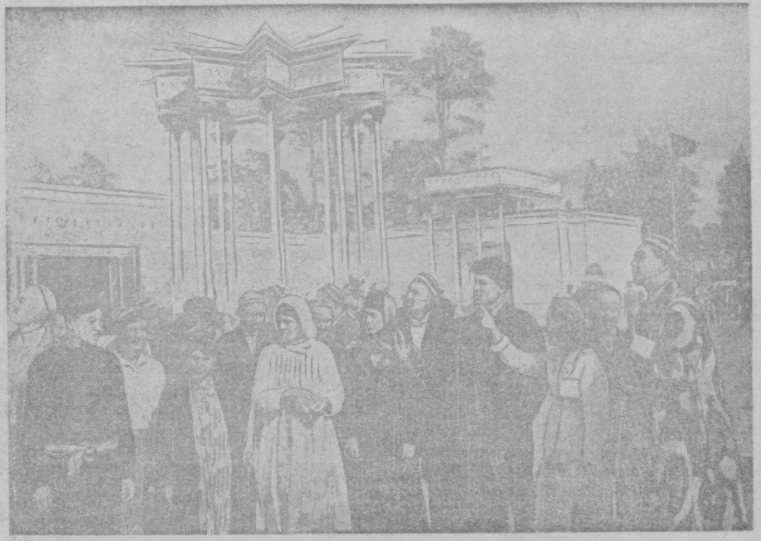
НА ВСЕСОЮЗНОЙ СЕЛЬСКОХОЗЯЙСТВЕННОЙ ВЫСТАВКЕ. Передовики сельского хозяйства Ферганской и Бухарской областей Узбекской ССР перед павильоном Узбекистана.

Во всех случаях аварий, произошедших вследствие неисправности автомашин, суды должны выносить частные определения о привлечении к ответственности лиц, виновных в небрежном ремонте или в выпуске на гаража неисправных машин.