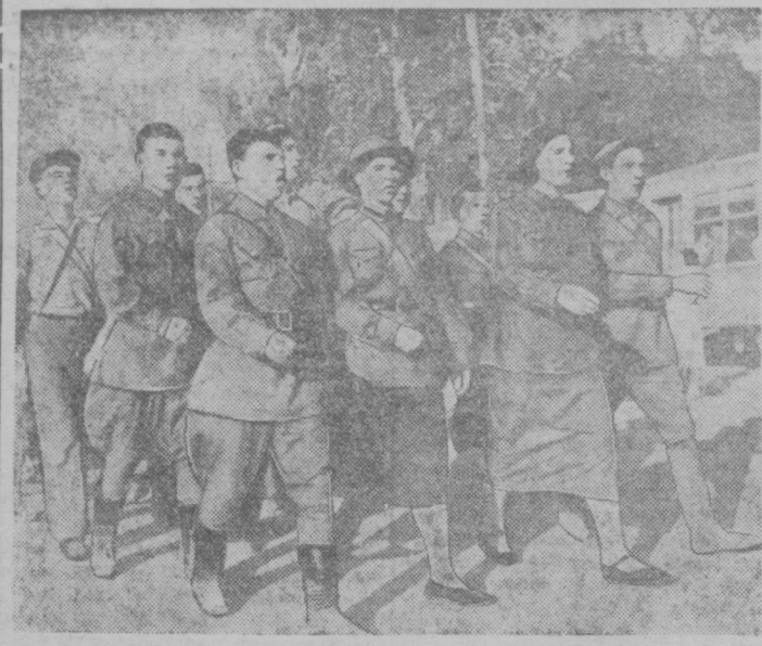
29 — 30 мая состоялось двухдневное тактическое учение призывников и комсомольцев г. Ташкента. На снимке: комсомолы Сталинского района идут на учения.