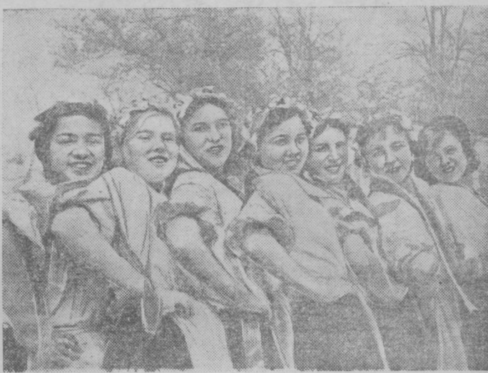
Благородный кружок самаркандского Дома пионеров разучивает украинский танец, который будет показан на областной олимпиаде в первой половине июня.

С 2 июня по всей Румынии вводится третий постный день в неделю. В постные дни запрещается употребление мяса.