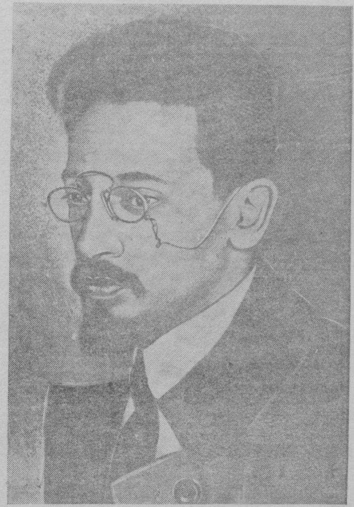
Яков Михайлович СВЕРДЛОВ.

Штаб вынужден опубликовать эти свои данные для того, чтобы положить конец смехотворной лжи о действительных потерях финнов во время советско-финского конфликта, систематически распространяемой финской, европейской и американской печатью.