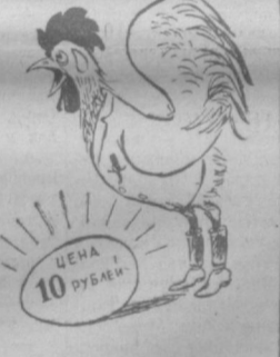
Петух — курам насмех... Рис. М. Воробейчикова.